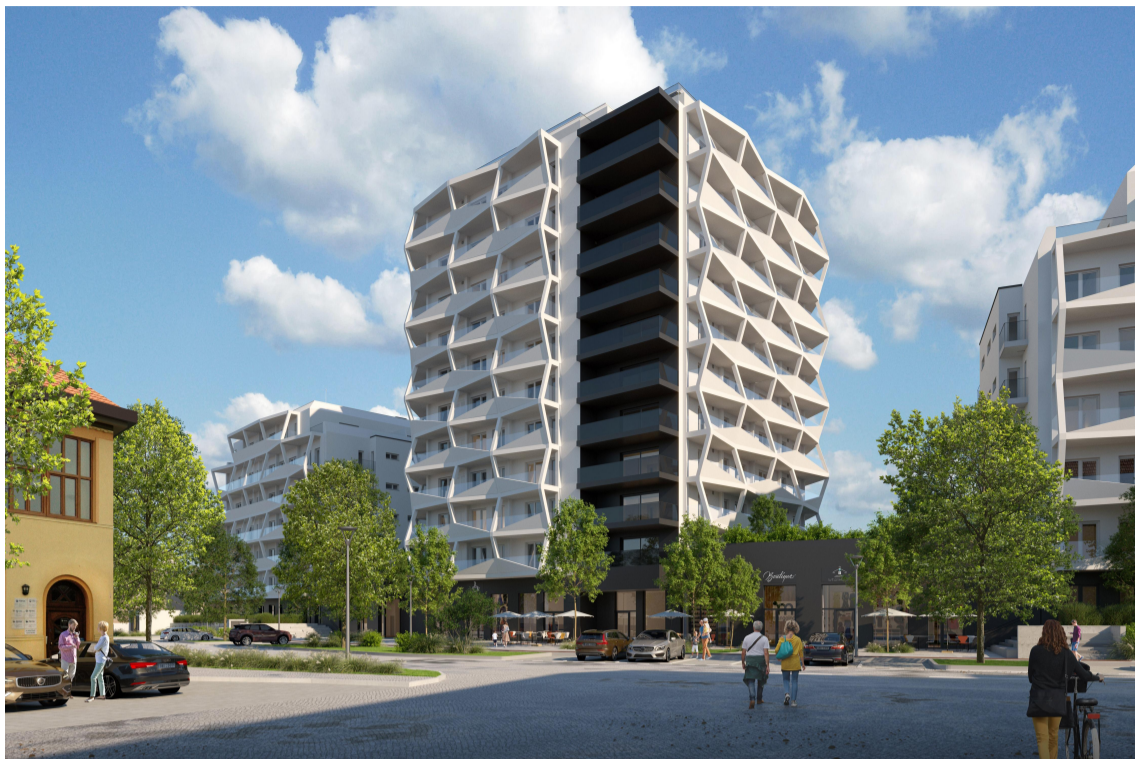
POHLED Z ULICE KOMÁROVSKÁ